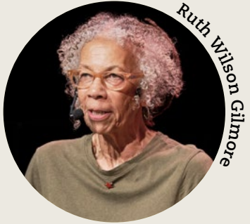
Ruth Wilson Gilmore